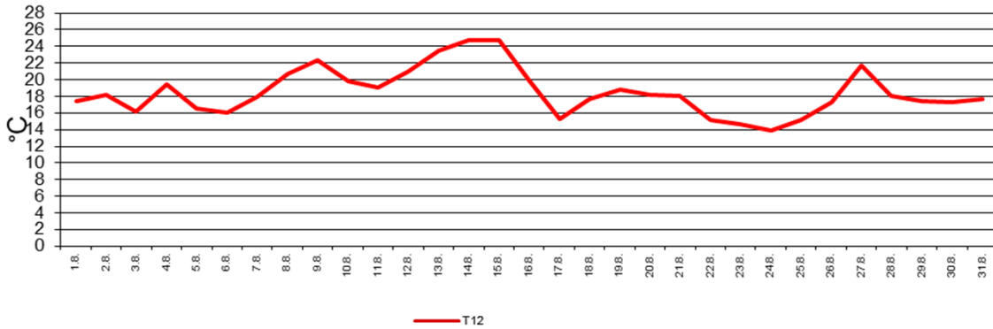
Temperatur: Tagesmaxima, Tagesminima, Tagesamplitude