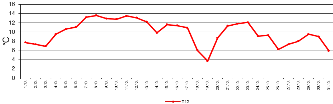
Temperatur: Tagesmaxima, Tagesminima, Tagesamplitude