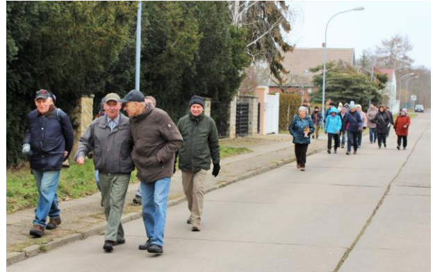
Wanderer auf dem Weg Richtung Gröna

In diesem Jahr übernahm ein Mitarbeiter des Naturparks Unteres Saaletal die Führung der traditionellen Winterwanderung der Ökostation Neugattersleben , da der langjährige Exkursionsleiter krankheitsbedingt ausgefallen war. Vom Treffpunkt Töpferwiese unterhalb des Bernburger Schlosses machten sich am 25. Januar Natur- und Wanderfreunde aus Bernburg und Umgebung auf den Weg in Richtung Gröna.