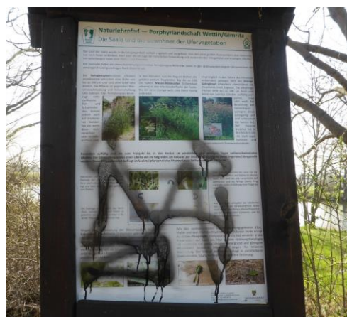
Infotafel bei Wettin, die durch die ASG saniert wird

Internetauftritt unter: www.kulturerbe.lhbsa.de