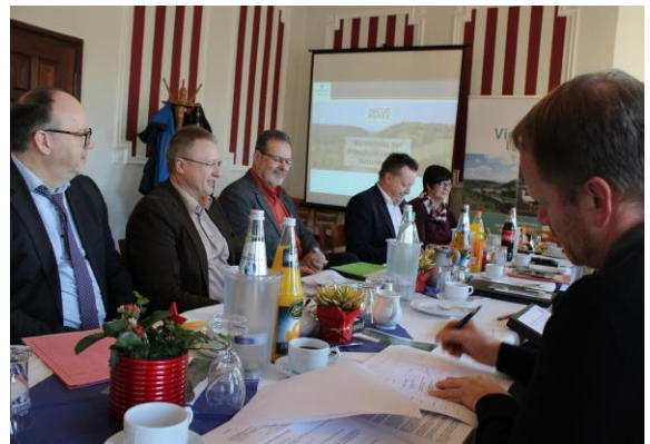
Klausurtreffen in der Georgsburg

Das diesjährige Klausurtreffen der Naturparkträger Sachsen-Anhalts fand am 24. Januar in der Georgsburg bei Könnern statt. Der kreative und fachlich fundierte Gedankenaustausch der aus unterschiedlichen Regionen Sachsen-Anhalts angereisten Klausurteilnehmer, bestehend aus Vertretern der Naturparke, des Ministeriums für Umwelt, Landwirtschaft und Energie Sachsen-Anhalt und des Landesverwaltungsamtes wurde inspiriert durch die schöne landschaftliche Lage in der Saaleaue direkt am Saaleradweg. Dabei wurde auch die unter Federführung des Landesverwaltungsamtes und unter Mitwirkung aller Naturparke Sachsen-Anhalts erstellte attraktive Broschüre über die Naturparke unseres Landes vorgestellt.