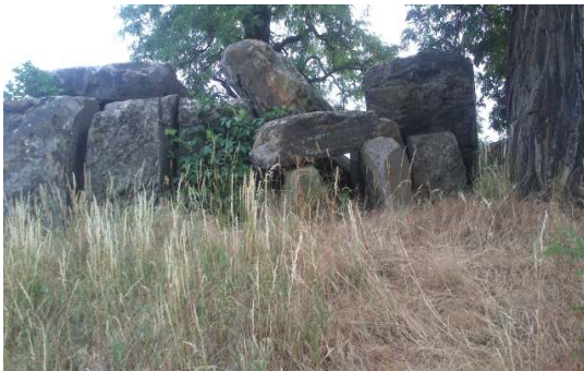
Großsteingrab der Steinzeitlandschaft Latdorf

Die Geschäftsstelle des Naturparks ist auch Anlaufpunkt für Schüler und Studenten um hier ein Praktikum zu absolvieren. Wie bereits im Februar und März fanden solche Praktika auch von Juni bis August statt. Dabei bekamen die Praktikanten Einblick in die Naturparkarbeit. Sie konnten durch praktische Tätigkeiten, z.B. Sanierung von Informationstafeln, Beseitigung von Abfall in der Landschaft oder durch gezielte Projektarbeit einen Beitrag zur Entwicklung des Naturparks leisten. Die folgenden Darstellungen und Bilder entstanden im Rahmen dieser Praktikumstätigkeiten.