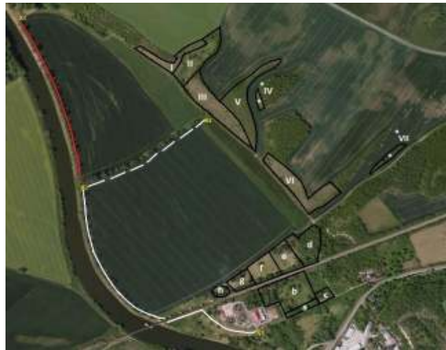
Biotopkartierung im Raum Könnern

Unsere diesjährige Herbstwanderung unter dem Motto: Natur und Steinzeit - zwischen Lunzbergen und Dölauer Heide am 17. Oktober (Start 09.30 Uhr, Straßenbahndendstelle Kröllwitz) zeigt die große Landschaftsvielfalt im nördlichen Randbereich der Stadt Halle.