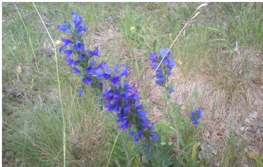
Der an Trockenstandorte angepasste Natterkopf