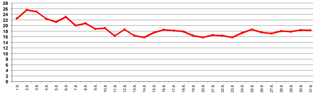
Temperatur: Tagesmaxima, Tagesminima, Tagesamplitude