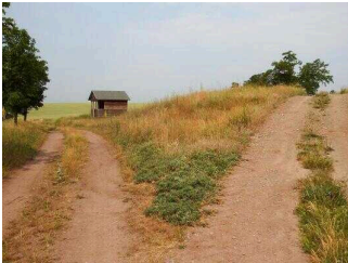
Wanderweg "Geopfad Wettin"