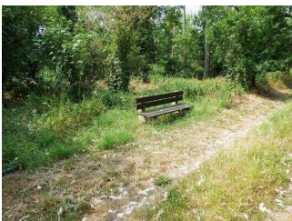
Wanderweg "Geopfad Wettin"