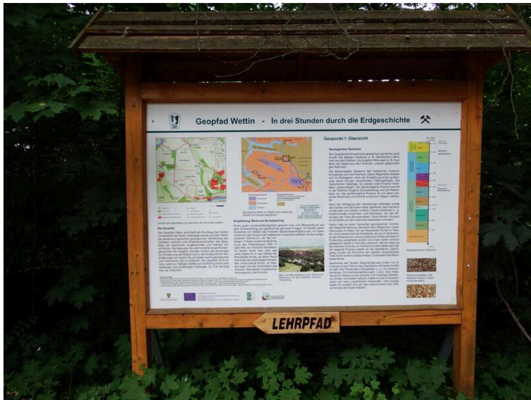
Wanderweg "Geopfad Wettin"