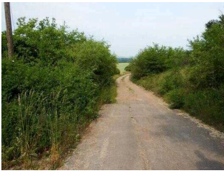
Wanderweg "Geopfad Wettin"