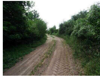
Wanderweg "Geopfad Wettin"