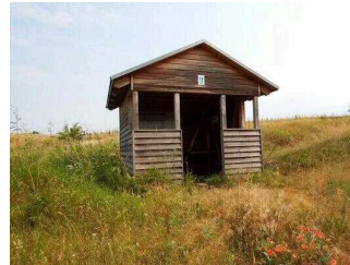
Wanderweg "Geopfad Wettin"