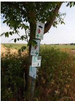
Wanderweg "Geopfad Wettin"