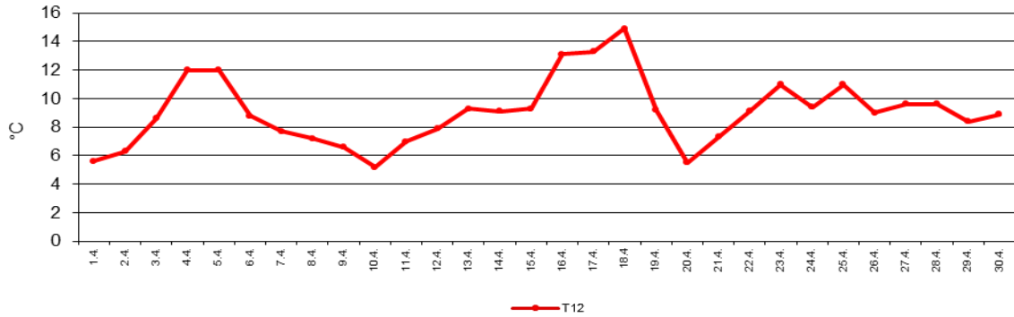
Temperatur: Tagesmaxima, Tagesminima, Tagesamplitude